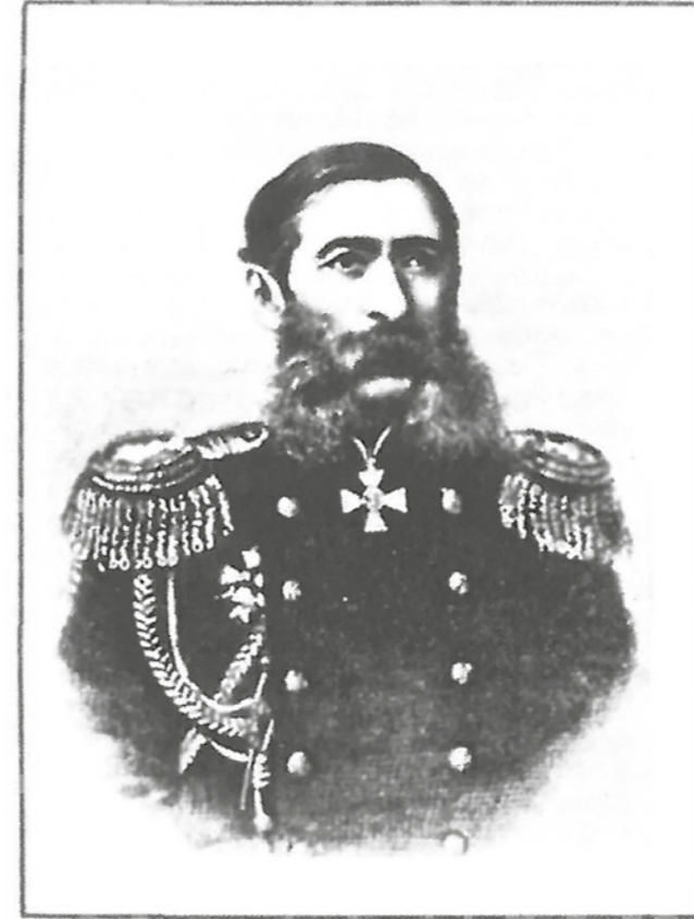
Граф М. Т. Лорис-Меликов.