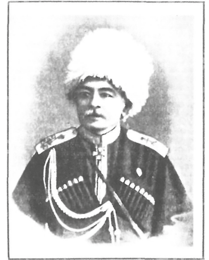
Генерал М. И. Драгомиров.